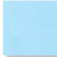
アルファカラー 青