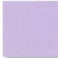
アルファカラー 紫